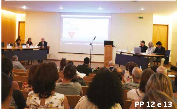
PP 12 e 13

Rastrear para prevenir é o lema do HMM para crianças e idosos do concelho